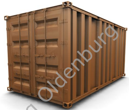
Container zum Transport von Ware

In einer chinesischen Turnschuhfabrik werden die Turnschuhe hergestellt und anschließend kontrolliert und in Kartons verpackt. Nun beginnt ihre lange Reise! Die Kartons werden in einem Container verstaut und anschließend mit einem Lkw zum Hafen transportiert. In einen herkömmlichen Container passen ca. 6.000 Schuhkartons. Meistens werden in einem Container aber verschiedene Waren wie zum Beispiel Turnschuhe, T-Shirts und Hosen transportiert.