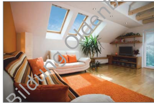
Wohnung mit ausländischen Gütern